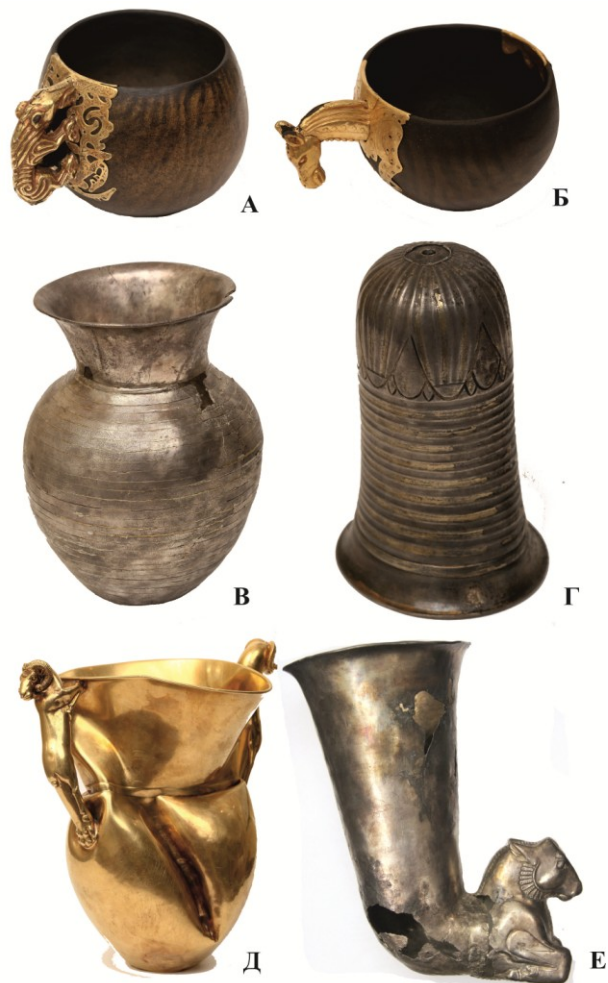
Рис. 1. Сосуды из кургана № 1 Филипповского могильника раскопок А.Х. Пшеничнюка, 1988 г.: А, Б – реконструкция деревянной посуды из тайника I; В – серебряный кувшин, инкрустированный золотой нитью; Г – серебряный ритон; Д – золотой кувшин; Е – серебряный ритон с протомой быка

ся, пористая масса» [3, Л. 11]. Данное содержимое представлено двумя видами веществ. Первый из образцов имеет темно-серый плотный комковатый вид размерам фрагментов от 1 до 4 см. Наиболее крупный фрагмент образца имеет характерное отверстие в центре донной части и диаметр стенок 4 см, что полностью совпадает с размерами и описанием указанного ритона.