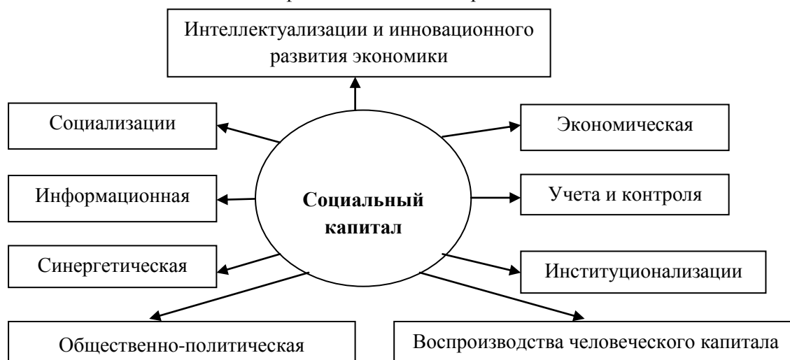
Рис. 1. Функции социального капитала

В общественной структуре выделяются три основных субъекта: государство — бизнес — население, взаимодействие которых определяется уровнем доверия друг другу. Американская компания Edelman опубликовала ежегодный аналитический доклад Edelman Trust Barometer 2018 [10], в котором оценивается уровень доверия граждан к различным институтам (рис. 2). За анализируемый период с 2012–2018 гг. уровень доверия граждан к институтам возрос: к правительству – на 15 п.п., к бизнесу – на 9 п.п., к медиа – на 3 п.п., но незначительно сократился уровень доверия к неправительственным организациям.