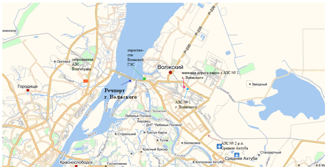
Рис. 1. Карта-схема мест проведения исследования

Анализ данных табл. 1 показал, что содержание нефтепродуктов в светло-каштановых почвах изменяется в пределах от 112 до 148 мг/кг, в аллювиальных почвах – от 108 до 158, а количество фракций нефтепродуктов, растворимых в водной вытяжке, находится в диапазоне от 12.32 до 37.84% в светло-каштановых почвах и от 11.69 до 32.28 – в аллювиальных. Близкие величины количества водорастворимых фракций, переходя-