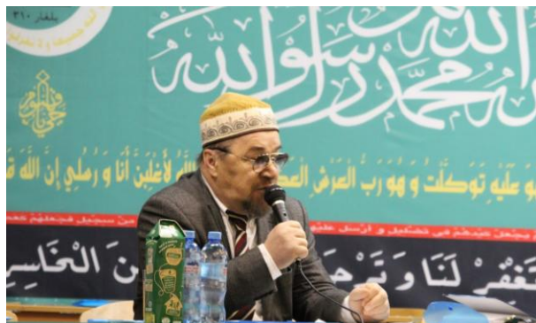
Теоретико-методологический семинар научного управления РИУ ЦДУМ России (2018 г.)