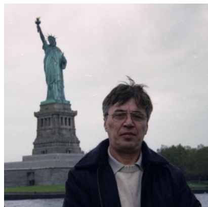
Во время стажировки в США (2003 г.)