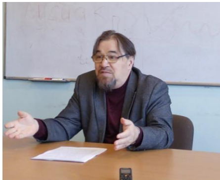
Забытая теория этноса. Лекция в ИИЯЛ (2017 г.)