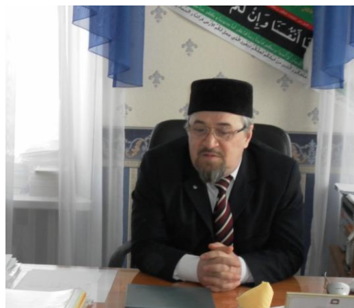
На заседании Всероссийской научно-практической конференции, посвященной 150-летию со дня рождения Ризаэтдина Фахретдина (2011 г.)

В 2010 г. он был избран членом Совета по исламскому образованию при Совете муфтиев России; с 2010 г. являлся членом Экспертного совета при Министерстве образования и науки РФ по разработке и внедрению учебного курса «Основы религиозных культур и светской этики»; членом экспертного Совета ВАК по специальности «Теология», ВАКовского журнала «Minbar. Islamic Studies»; главным редактором, членом редколлегии и редсовета научно-теологического альманаха «Дары знаний» (Уфа); международного «Дайджест-Бюллетеня РИУ ЦДУМ России» и т.д.