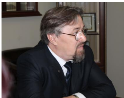
Кузеевские чтения (2012 г.)