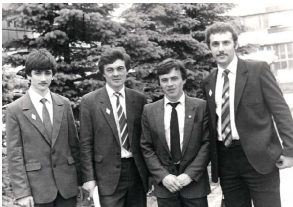
Выпускники историко-английского факультета Башкирского государственного педагогического института (1985 г.)