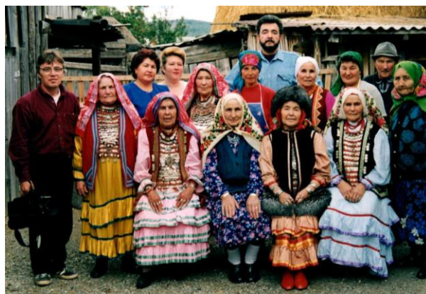
В этнографической экспедиции (2001 г.)